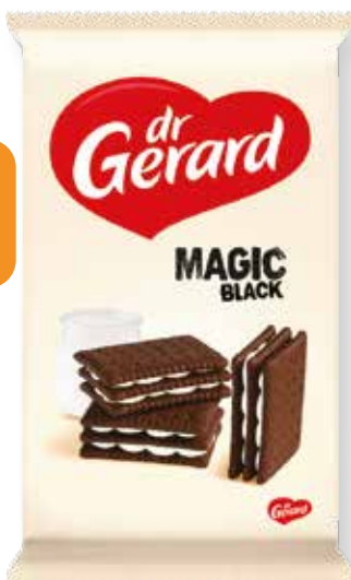
SUŠIENKY MAGIC BLACK 330g kód: 29167 bal: 8/N