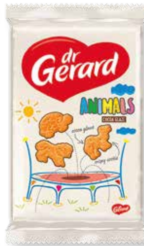
SUŠIENKY ANIMALS ZDOBENÉ POLOMÁČANÉ 165g kód: 20563 | bal: 12/N