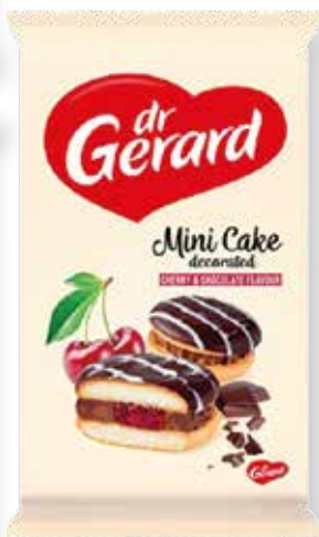
SUŠIENKY MINI CAKE CHERRY 165g kód: 221241 | bal: 12/N