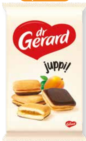
PIŠKÓTY JAŠKY / JUPPI! JABLKO-MARHUĽA 205g kód: 21906 | bal: 8/N