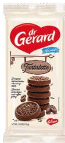
SUŠIENKY TARTALETTE COFFEE 165g kód: 219332 | bal: 20/N