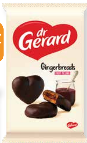
PERNÍK SRDCE V ČOKOLÁDE 175g kód: 20338 | bal: 12/N