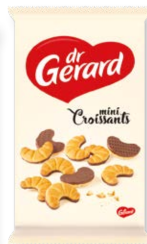
SUŠIENKY CRISPY MINI CROISSANTS WITH COCOA GLAZE 165g kód: 210157 | bal: 12/N