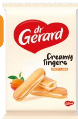
PIŠKÓTY PALEČKY SMOT. MARH. 170g kód: 16382 bal: 12/N