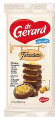
SUŠIENKY TARTALETTE 165g POPCORN & SLANÝ CARAMEL kód: 219333 | bal: 20/N