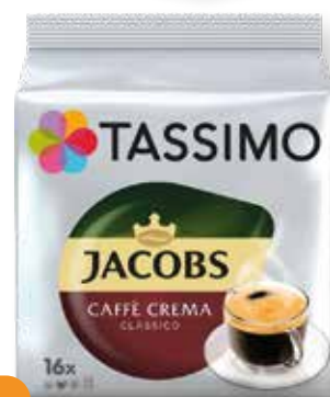
MLETÁ KÁVA KAPS TASSIMO CAFE CREMA 16CAP. 112g JACOBS