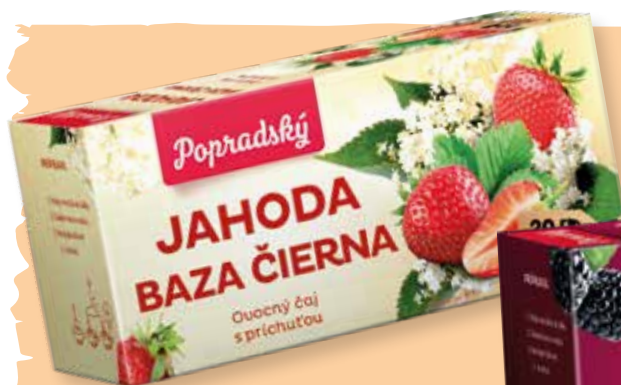
JAHODA - ČIERNÁ BAZA kód: 29739, 29738