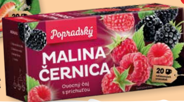
MALINA - ČERNICA kód: 19744