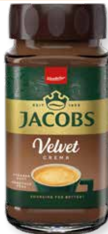
kód: 219162, 219470 bal: 5/A